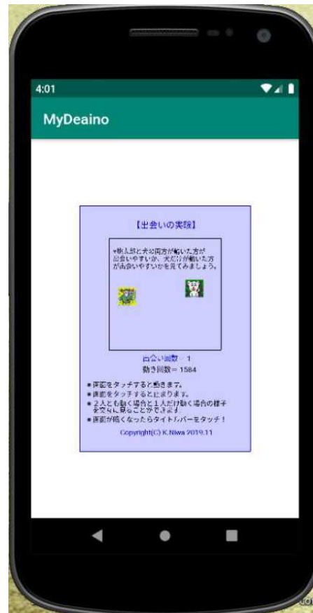
【エミュレータ画像】