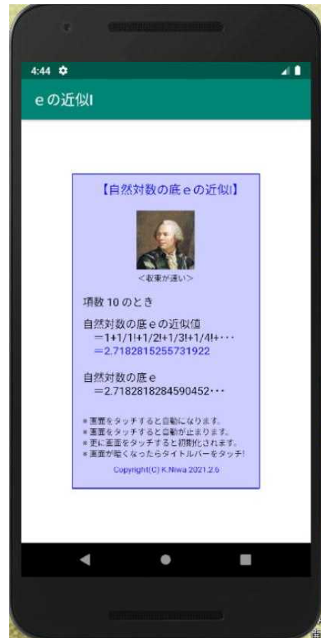
【エミュレータ画像】