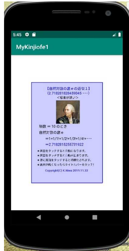
【エミュレータ画像】