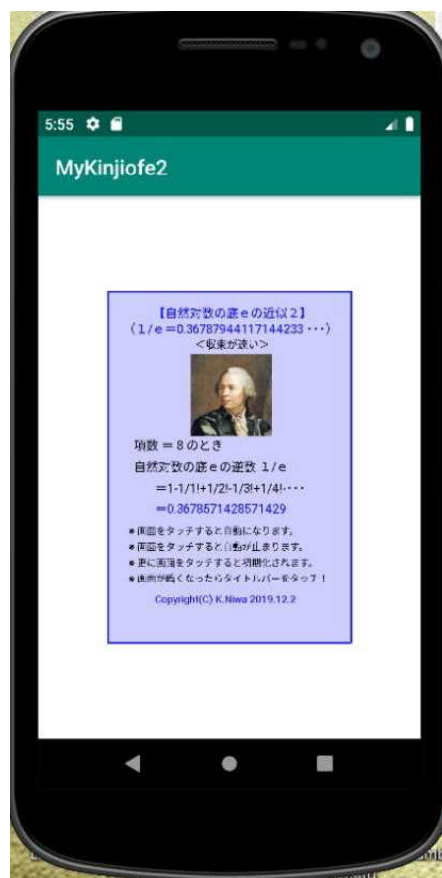
【エミュレータ画像】