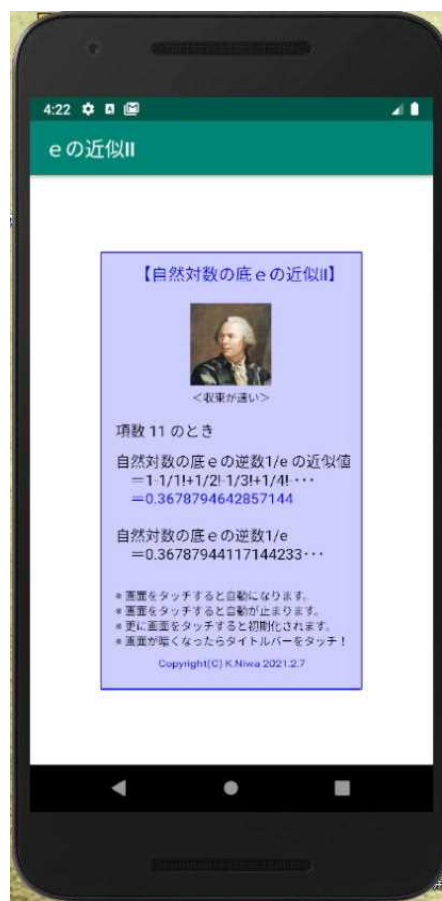
【エミュレータ画像】