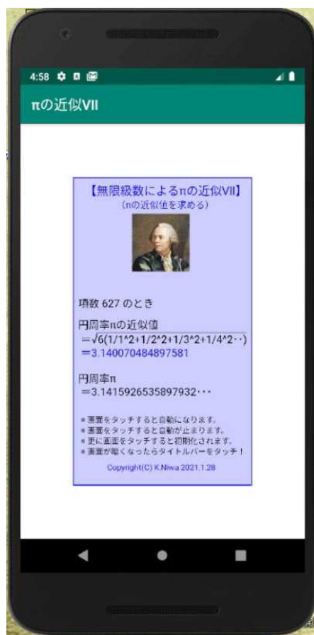
【エミュレータ画像】