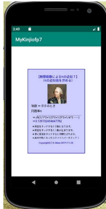
【エミュレータ画像】