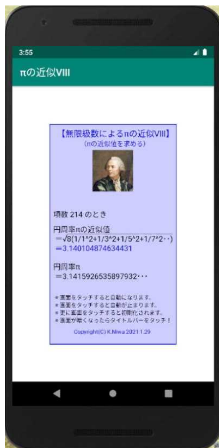
【エミュレータ画像】