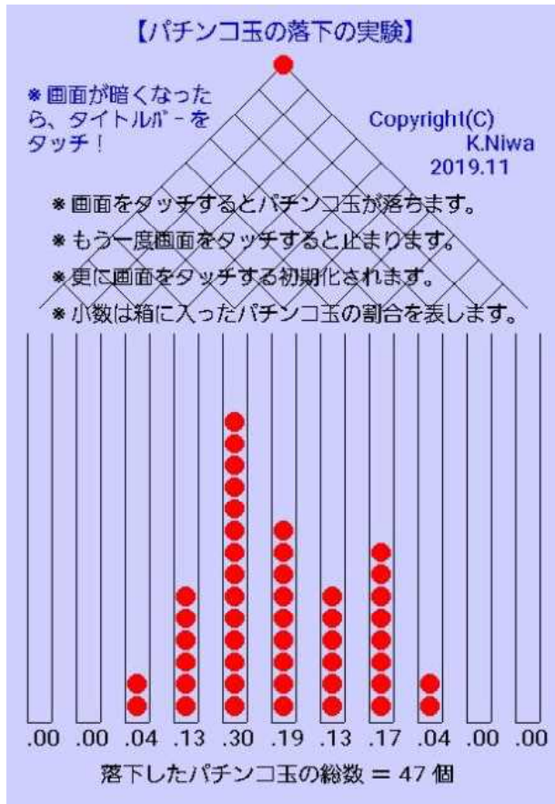
【スクリーンショット】