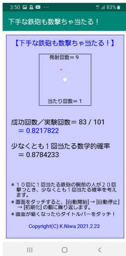
【スクリーンショット】

※ 下手な鉄砲撃ちが鉄砲を撃ち、数多く撃てば少なくとも1回は当たる可能性が高い様子を観察します。