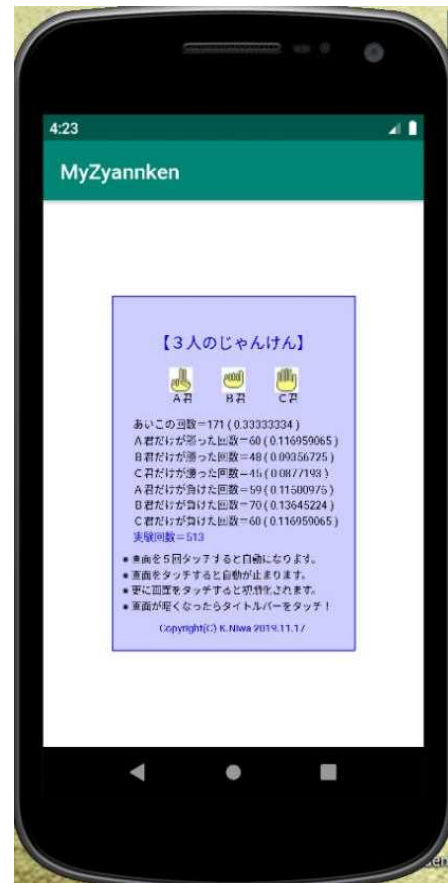
【エミュレータ画像】