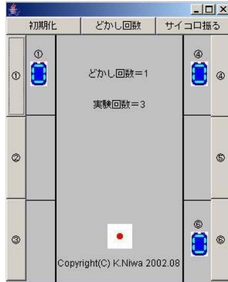
[ J a v a アプリケーション ]